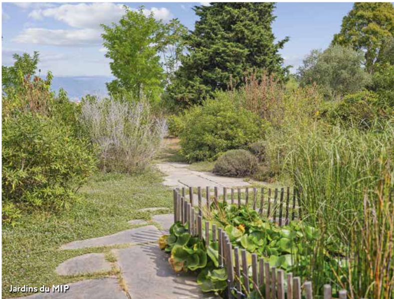
Jardins du MIP