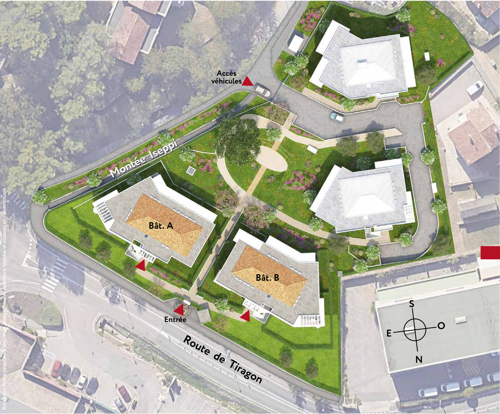
Illustration libre à caractère d'ambiance. Aménagements extérieurs, façades et couleurs non contractuels