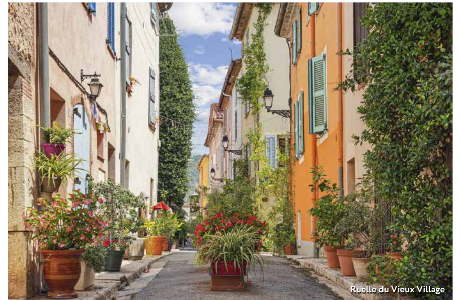
Ruelle du Vieux Village