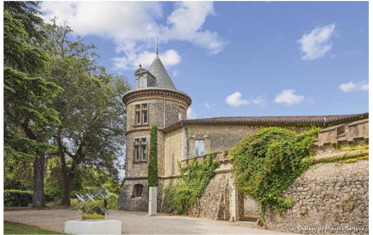
Château de Mouans-Sartoux