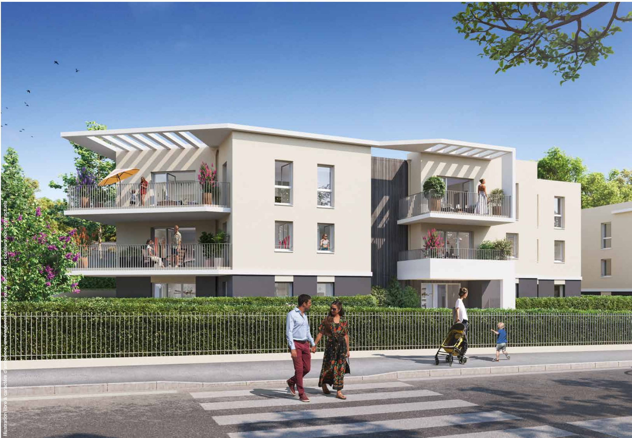
Illustration libre à caractère d'ambiances, aménagements extérieurs, façades et couleurs non contractuels