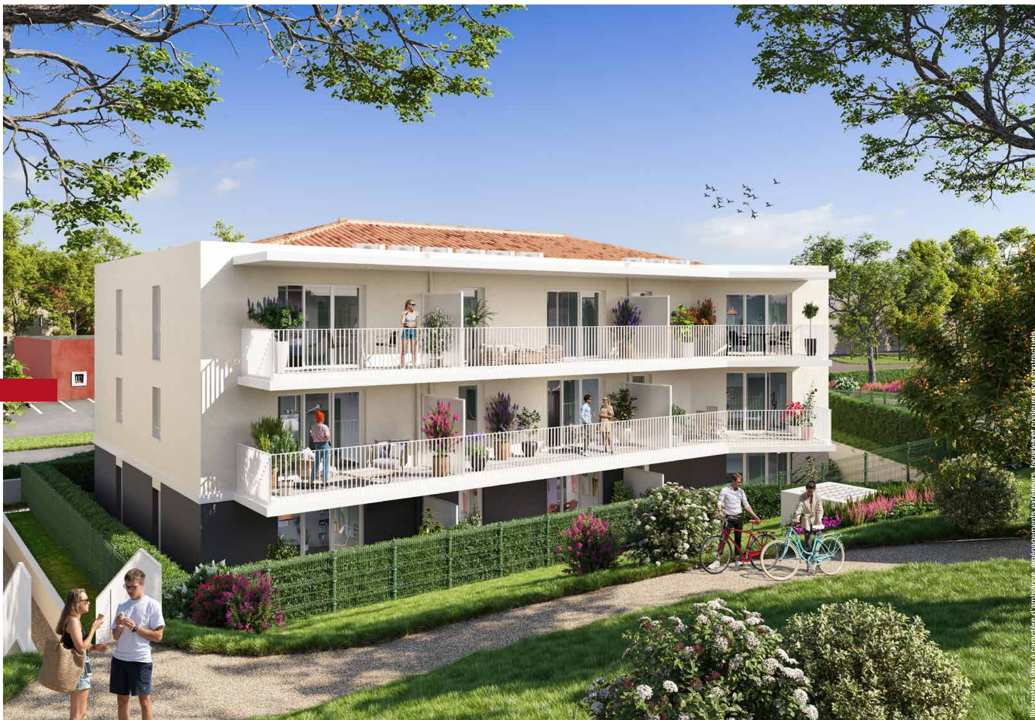
Illustration libre à caractère d'ambiance, aménagements extérieurs, façades et couleurs non contractuels