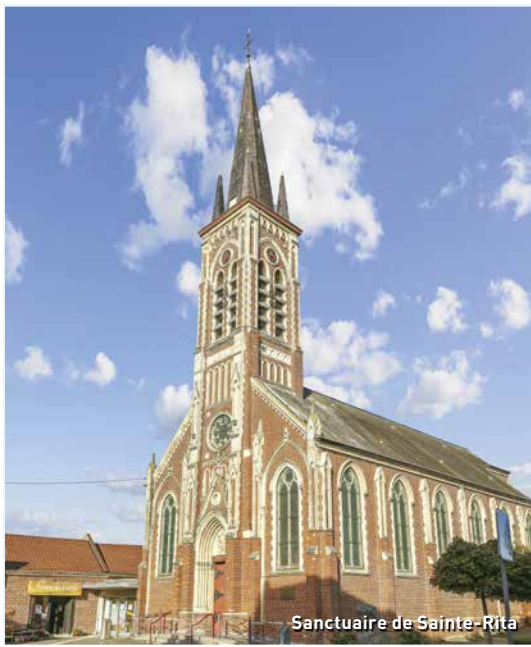
Sanctuaire de Sainte-Rita