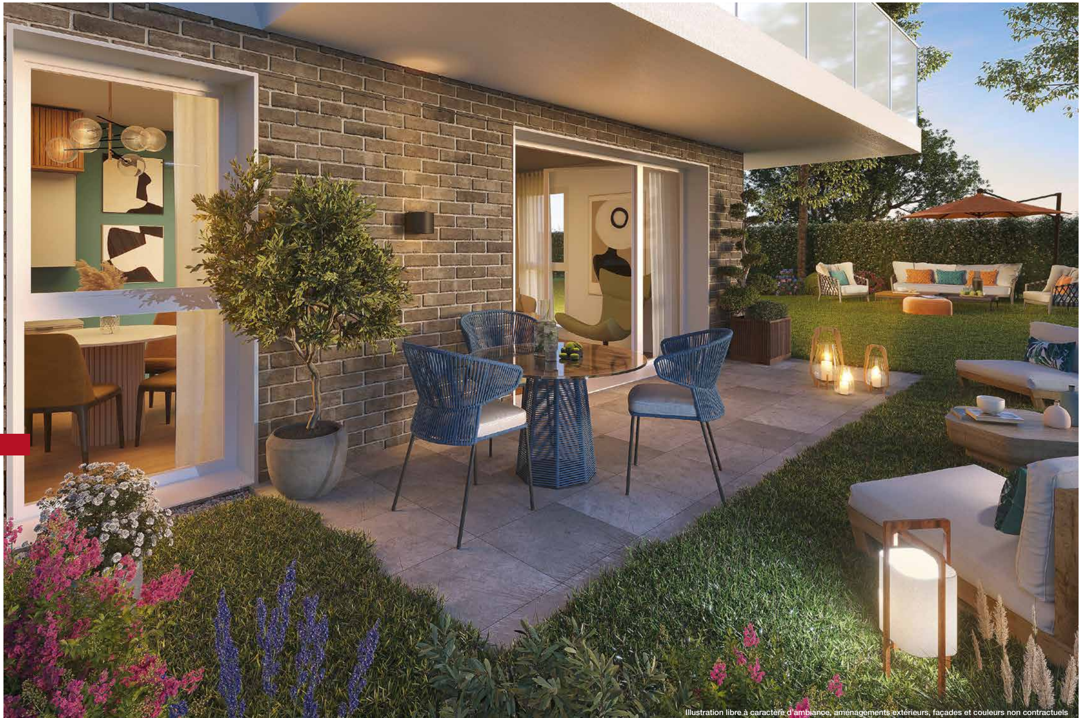
Illustration libre à caractère d'ambiance, aménagements extérieurs, façades et couleurs non contractuels