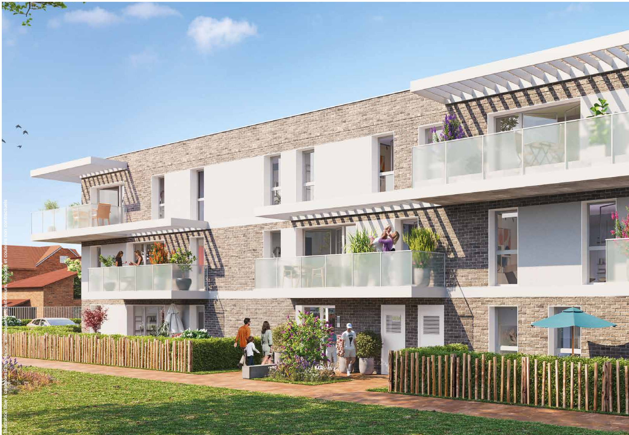
Illustration libre à caractère d'information, aménagements extérieurs, façades et couleurs non contractuels