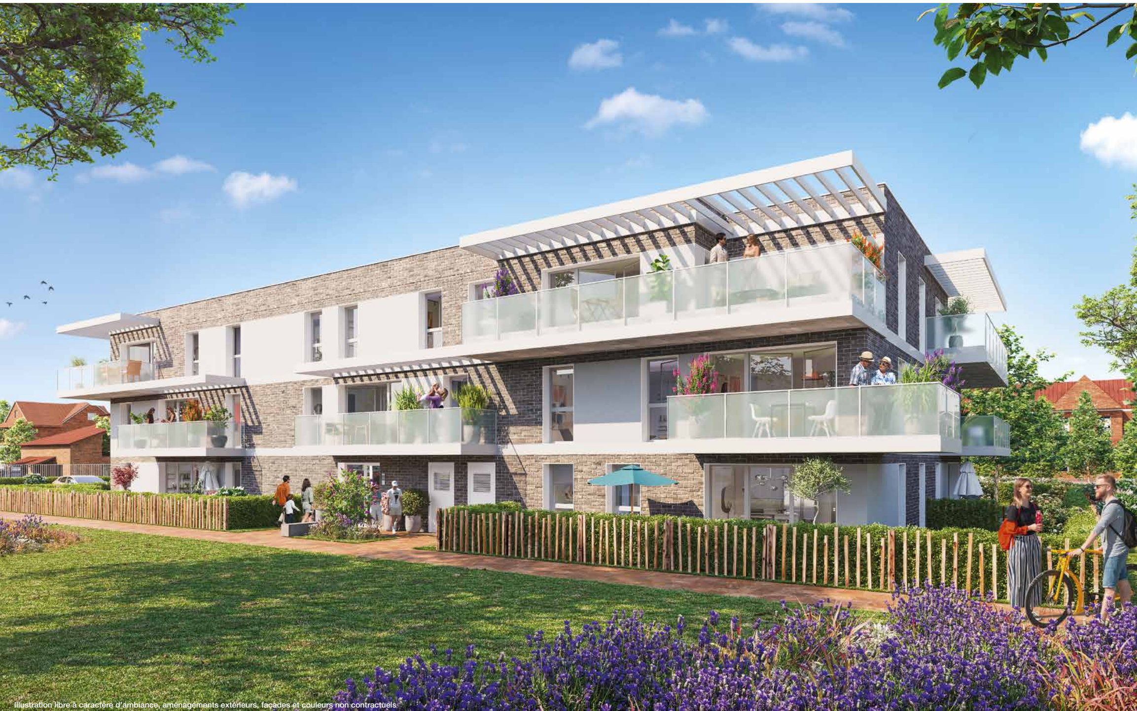
Illustration libre à caractère d'ambiance, aménagements extérieurs, façades et couleurs non contractuels.