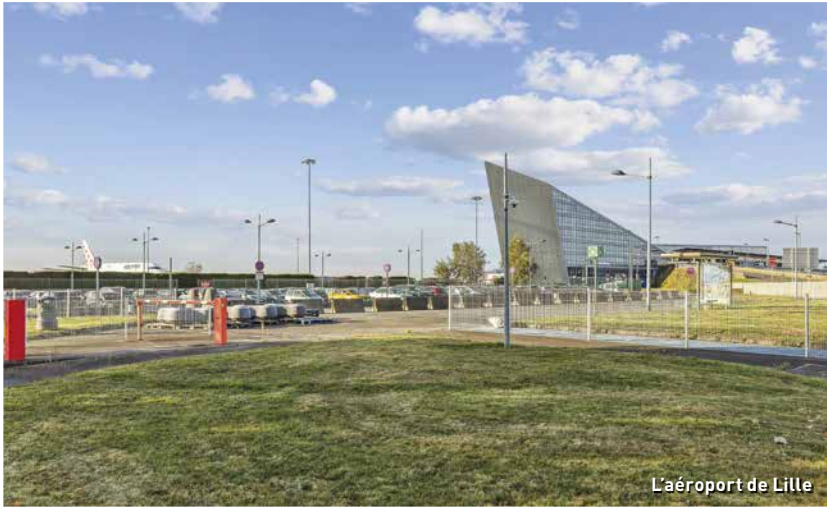
L'aéroport de Lille