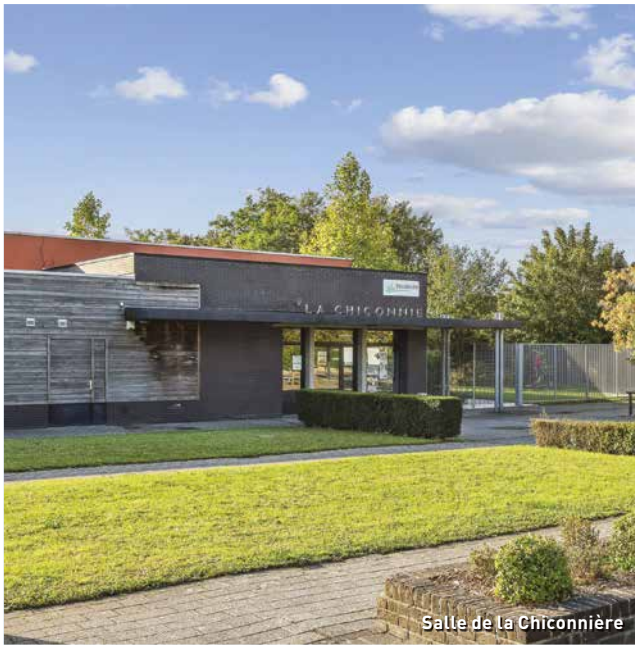
Salle de La Chiconnière