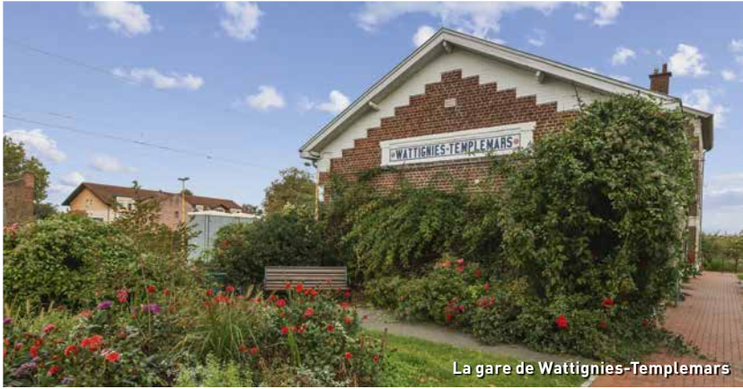
La gare de Wattignies-Templmars